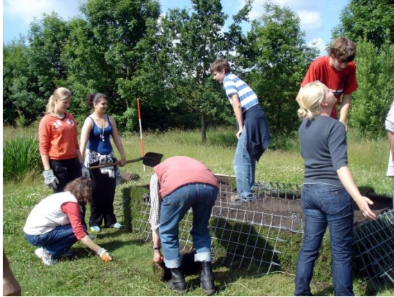
Bau eines Grassofas