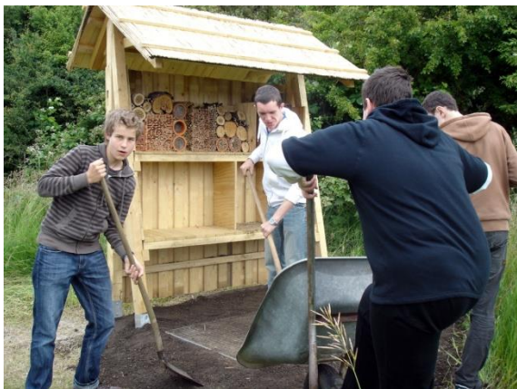
Ein Insektenhotel entsteht