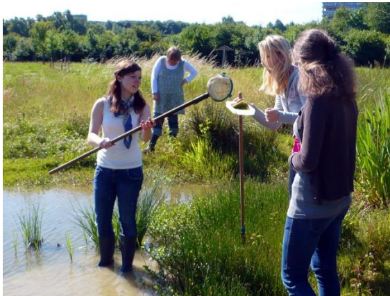
Was lebt im Teich?