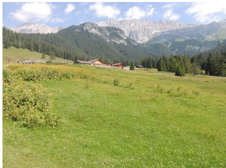
Bild links die Hemermoosalm. Eine kleine Gruppe stieg alternativ über die Wettersteinhütte zum Scharnitzjoch auf und von dort über das Puit-Tal nach Leutasch-Weidach ab. Das hoch gelegene Tal wird für den Wintersport nicht genutzt und ist der Almwirtschaft vorbehalten. Im mittleren Teil war ein großer Bereich der Almwiesen vermutlich durch einen Lawinenabgang regelrecht umgepflügt worden.

Eine weitere Wanderung führte in der Leutasch über mehrere Almen. Im