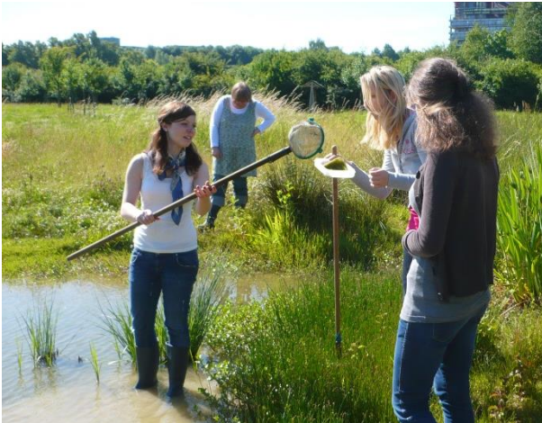
Was lebt im Teich?