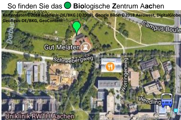
Gut Melaten Schneebergweg 30, 52074 Aachen