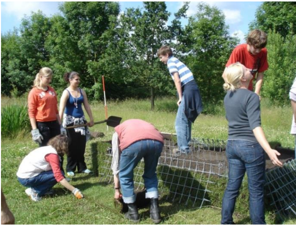
Bau eines Grassofas